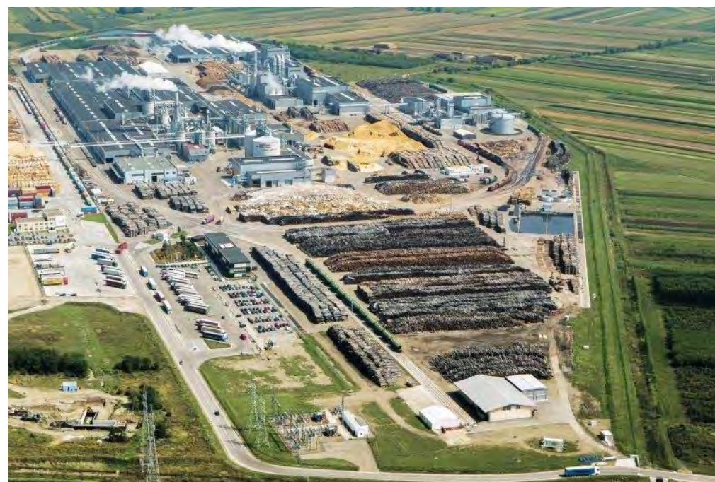
Fabrica EGGER din Rădăuți